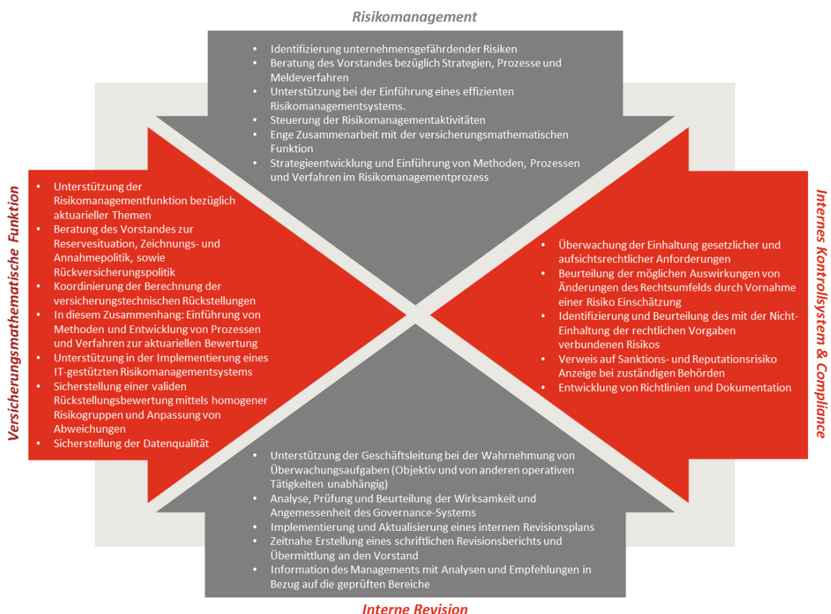
Abbildung 2 – Schlüsselfunktionen

In der Abbildung 2 werden die einzelnen Schlüsselfunktionen nochmals angeführt und ihre einzelnen Aufgaben und Funktionen innerhalb des muki VVaG näher erläutert.